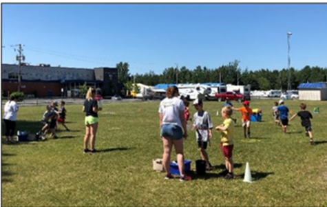
Figure 2 : Jeu du « Boogie bac » au camp de jour d'Acton Vale (RIAM, 2018)

Au cours de l'été 2018, l'Équipe verte a circulé sur le territoire des municipalités membres de la Régie afin de sensibiliser les citoyens à l'amélioration de la gestion de leurs matières résiduelles. Les membres de l'équipe ont notamment animé des ateliers, au bénéfice de 65 groupes de jeunes inscrits à 28 camps de jour différents, ce qui représente plus de 1300 jeunes qui ont ainsi été rencontrés.