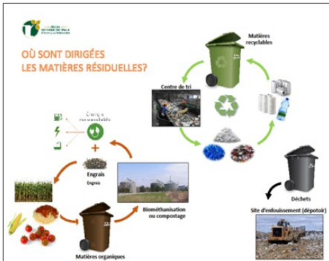
Figure 1: Affiche permettant de visualiser la destination des matières contenues dans les différents bacs (RIAM, 2018).