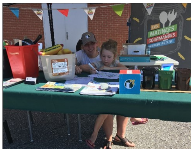
Participation de l'Équipe verte aux Matinées gourmandes au cours de l'été 2018.

Cette année a été une année record au niveau du nombre de citoyens rencontrés par l'Équipe verte dans les différents événements municipaux. En effet, près de 700 personnes se sont présentées au kiosque lors des diverses Matinées gourmandes et dans le cadre du Festival du maïs de Saint-Damase. La participation à divers événements permet de sensibiliser les citoyens de tous âges, de répondre à leurs interrogations et de démystifier certaines informations véhiculées par les médias nationaux. Dans ce contexte, l'Équipe verte se doit de maintenir, lorsque possible, sa présence dans le cadre d'événements municipaux.